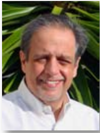
Dr. Pablo Echarrí

4 días de duración. Fechas: 15 y 16 de enero y 5 y 6 de febrero de 2010